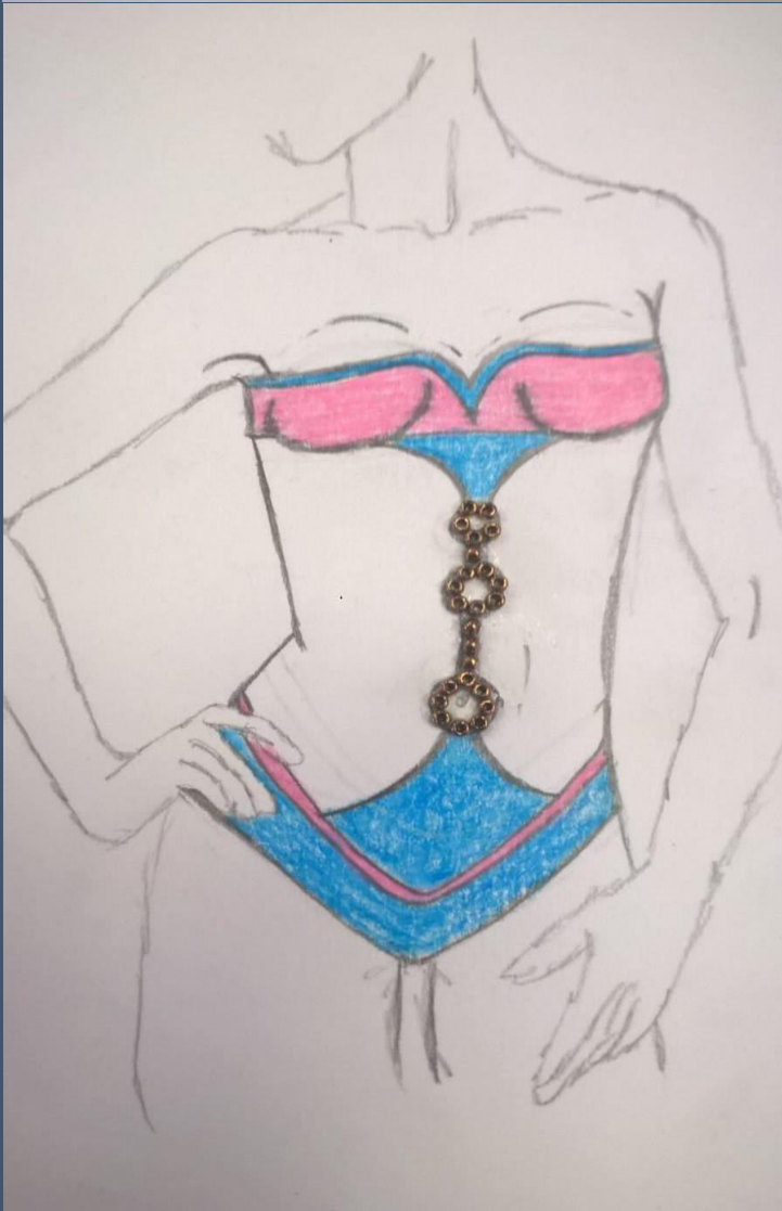
Figurino con proposta di mini collezione costume da bagno femminile in differenti varianti di colore e con l'utilizzo di materiali decorativi